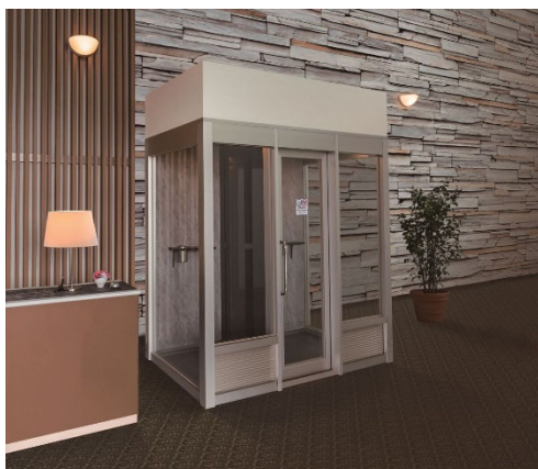
ホテル・ホール・ロビーなど