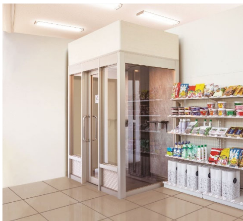
コンビニ・スーパーなど