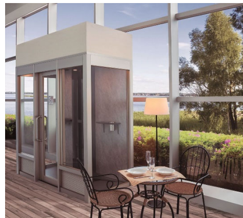
カフェ・レストラン・商業施設など

本件に関するご連絡先： セイキ総業（株）石原 TEL:04-2951-7221 shuji@seikiscreensystems.com